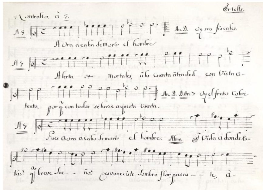
Figura 3. Particella de contralto del primer oratorio del que se conserva música: Oratorio al Juicio Particular, Antonio Teodoro Ortells [Valencia, 1703].