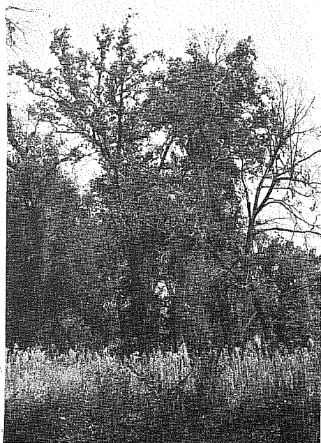
FIGG. 1-5 - Alcuni ambienti del bosco di Policoro.